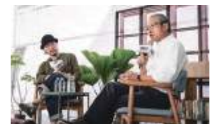
2018 朗讀節 本會資料