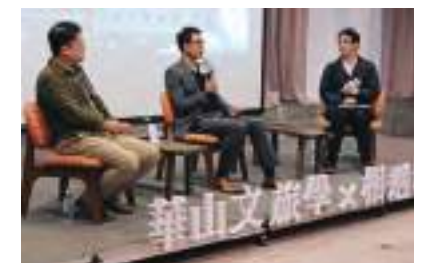
2018 華山文旅學 × 相遇地方 本會資料