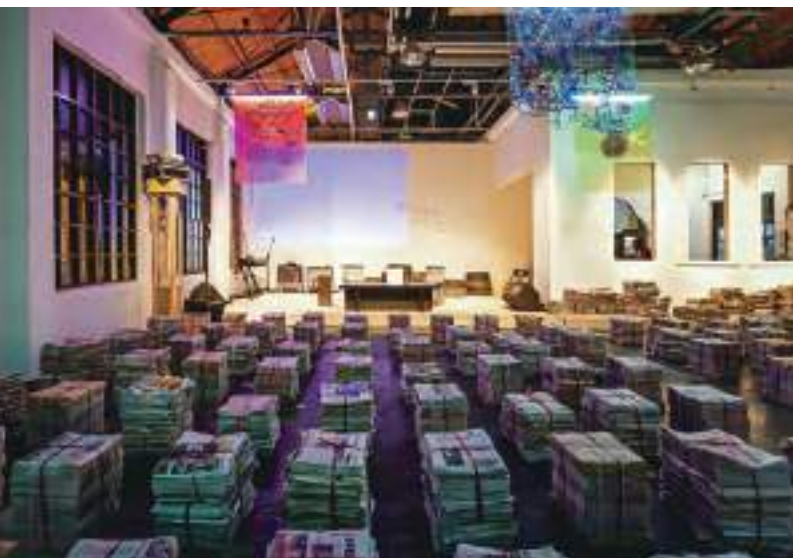
1. 一摞一摞的「報紙堆」，是一段一段時間的腳印，也是這一屆華文朗讀節會場的座椅。我們坐在上面，遙想 50 年前的革命，置放今時今日的熱血。

而「閱讀」與「朗讀」之間最大分野的「聲音」，自然不會在此缺席。「詩歌之夜」及「讀樂之夜」便分別從不同角度詮釋創作，豐富讀者的感官體驗：前者除了邀請詩人現身朗讀外，更找來演員粉墨登場，詮釋詩作；後者則邀請音樂人演出並分享各自的作品。