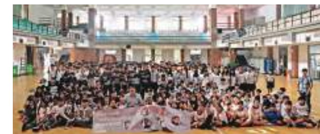
華文朗讀節—校園朗讀。