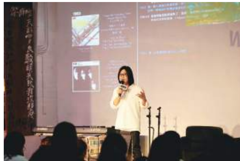
2. 五月天貝斯手瑪莎這次不表演，而是拿起麥克風分享他所知的六〇年代音樂。