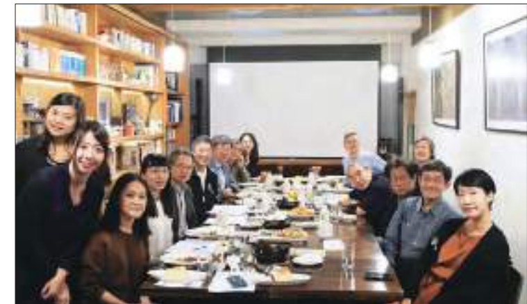
2018 年 11 月基金會董事會合照。