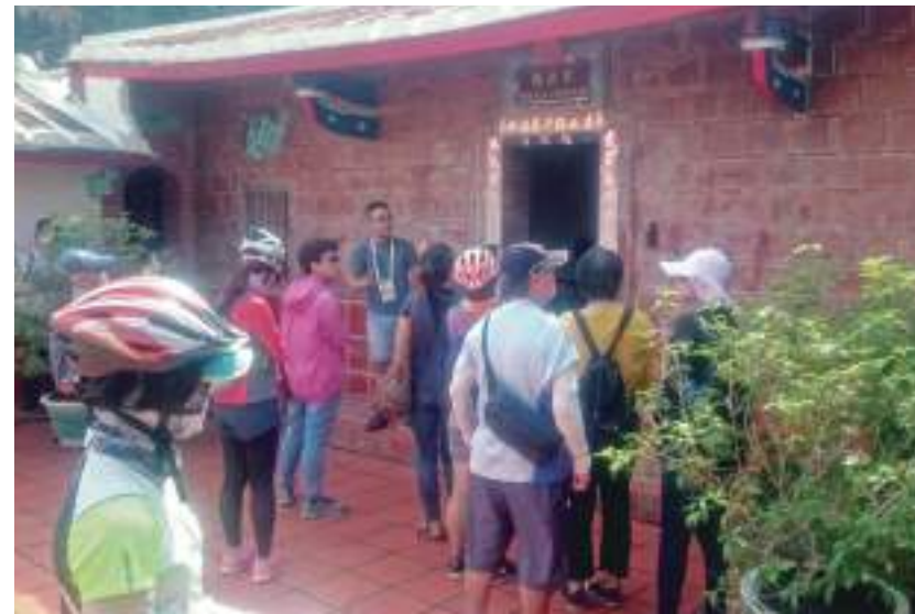
6. 作家陳坤毅帶著大家走訪高雄內惟。