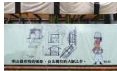
2011-2 藤森照信