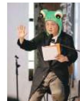
華文朗讀節—馮翊綱。