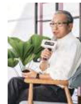
華文朗讀節—吳念真。