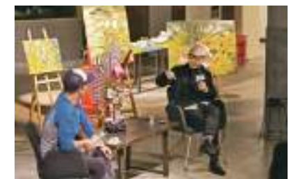
2015 文創沙龍 本會資料