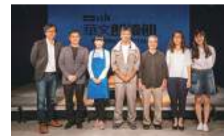
華文朗讀節—記者會。