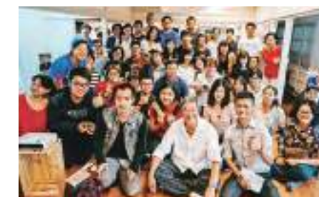
華文朗讀節—王偉忠。