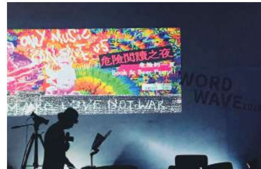
4. 「危險閱讀之夜」下半場邀請讀者上台朗讀段落，分享他們的「危險之書」。