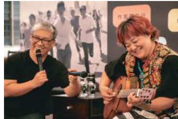
1. 作家巴代與金曲歌后桑梅絹分享，現場氣氛十分融洽。