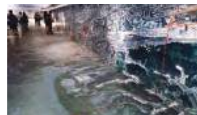
2012 工業遺產