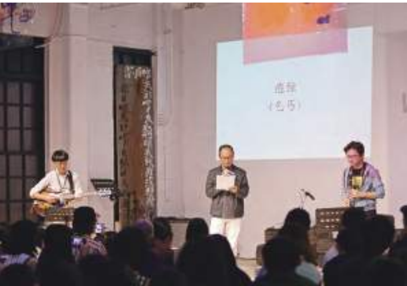
5. 「詩歌之夜」策展人鴻鴻朗讀詩人痲弦作品。