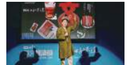
2017 朗讀節 本會資料