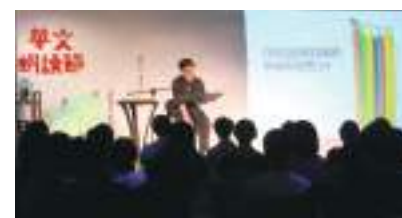
2013 朗讀節