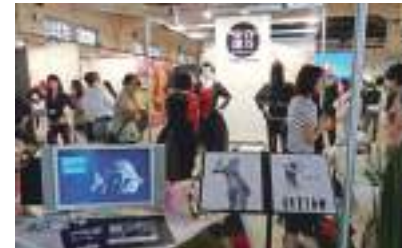
2009 畢業季

TICCIH Congress 2012 國際工業遺產保存委員會年會移師台北華山文創產業園區舉辦，為國際工業遺產保存委員會成立近 40 年來首度在亞洲地區召開年會，並於會中通過正式 TICCIH 國際組織宣言：《亞洲工業遺產台北宣言》。