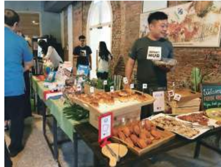
1. 家樂福文教基金會準備的早餐小 buffet。