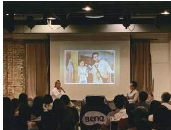
1. 導演許智彥分享《誰先愛上他的》劇照。