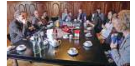
2015 台德交流 本會資料

透過「文創」「旅遊」和「學習」三大面向，與台灣地方工作團體攜手共創，除實體活動外，也將代表性個案整理為可持續推廣之教材，期能打造屬於台灣的地方知識、經驗和資源分享平台，並將台灣各地的文化創意帶到華山文創產業園區，讓更多人認識地方，進而走入地方。